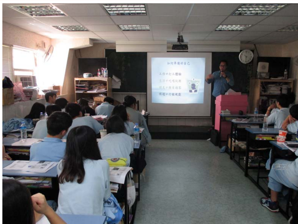
應用外語科日文組-三年禮班 103/10/29 活動情形：文字格式設定