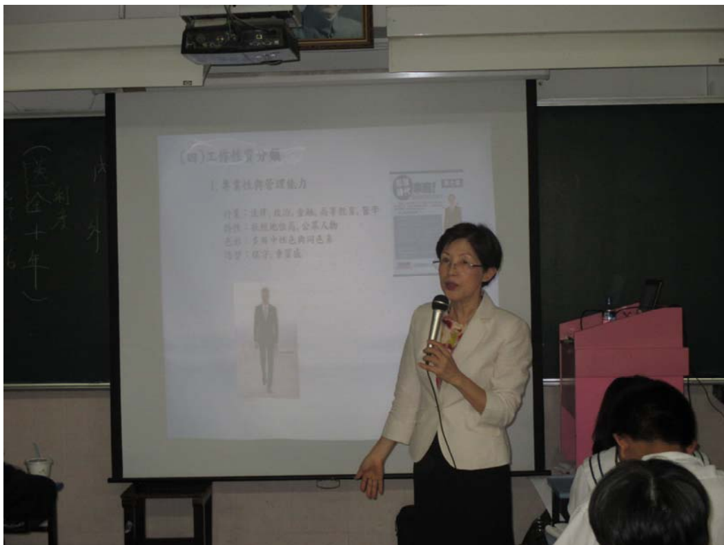
應用外語科日文組-三年義班 103/11/12 活動情形：簡報的邏輯與架構