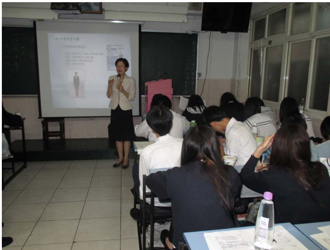
應用外語科日文組-三年義班 103/11/12 活動情形：簡報的重要性