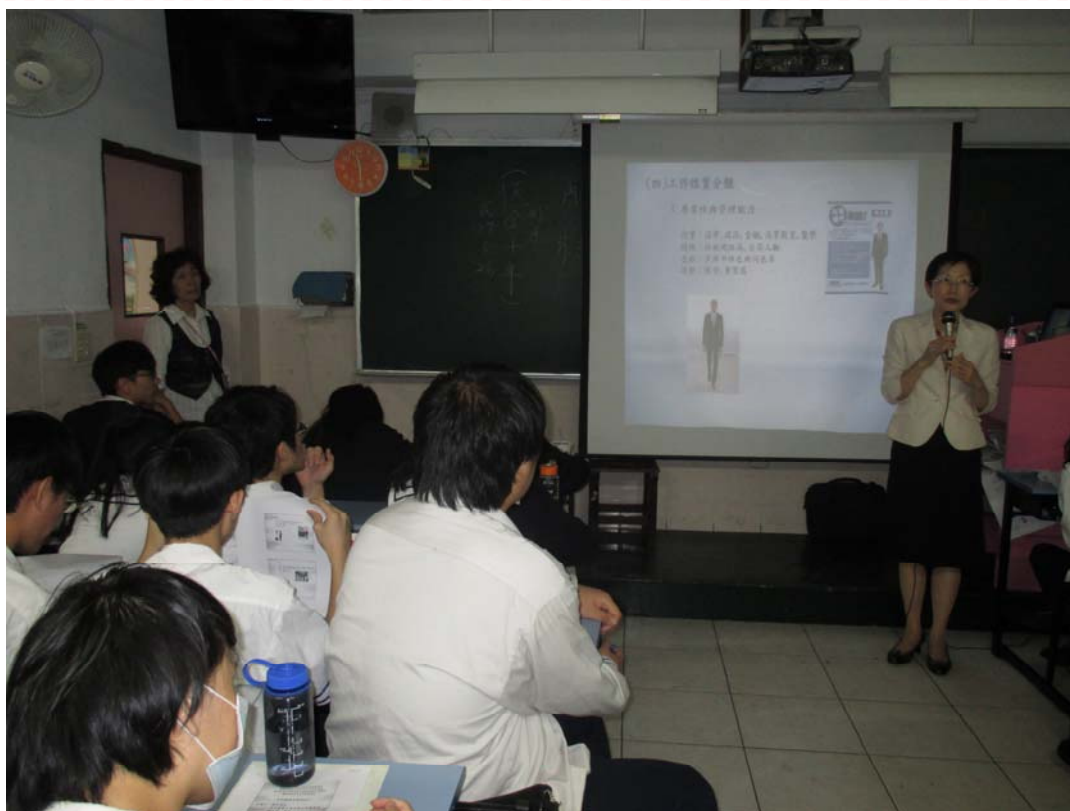
應用外語科日文組-三年義班 103/11/12