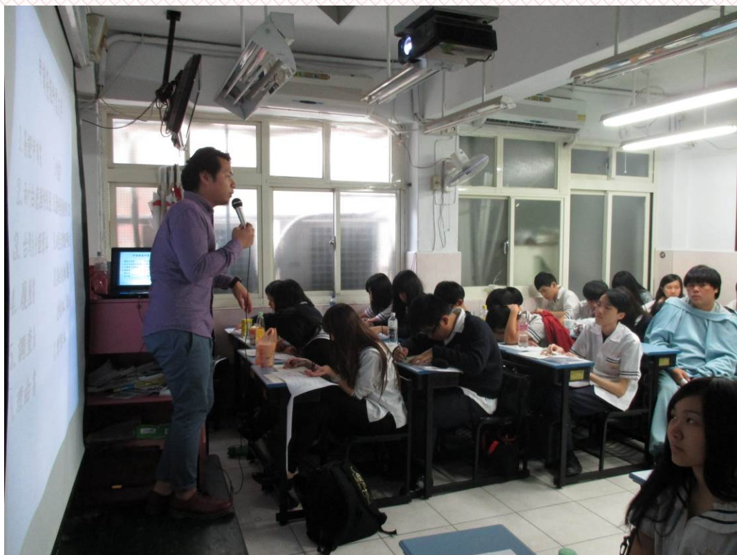
應用外語科日文組-三年義班 103/11/26 活動情形：打工度假介紹