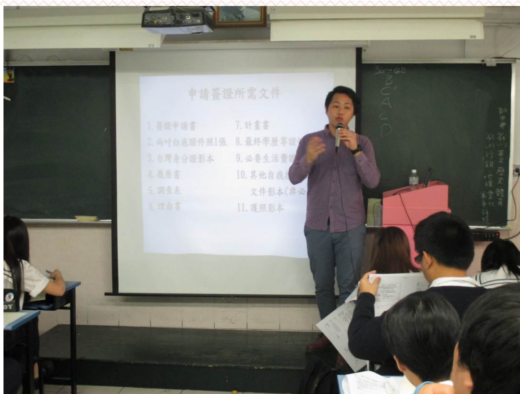
應用外語科日文組-三年義班