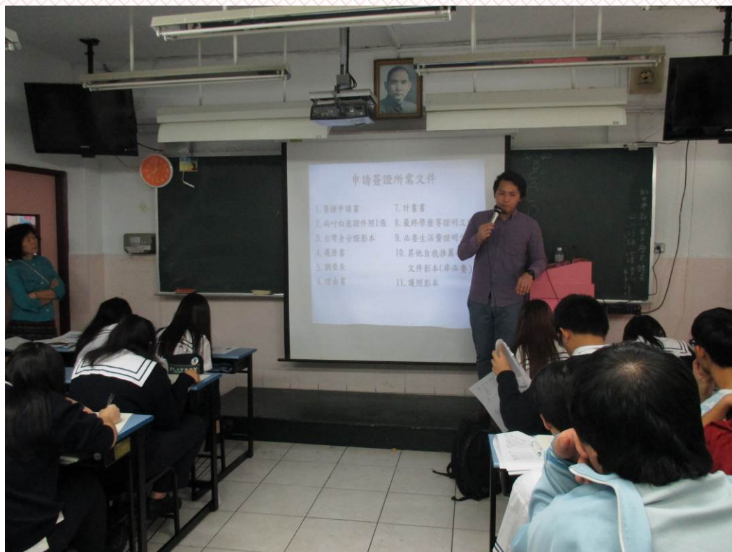
應用外語科日文組-三年義班 103/11/26 活動情形：業師經驗分享