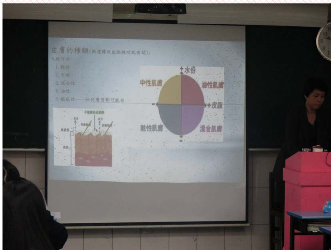
應用外語科日文組-三年禮班 104/03/25 活動情形：多吸收保養知識