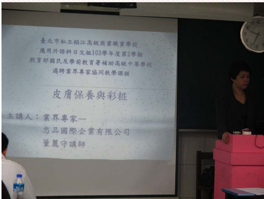
應用外語科日文組-三年禮班 104/03/25 活動情形：油性皮膚首重清潔