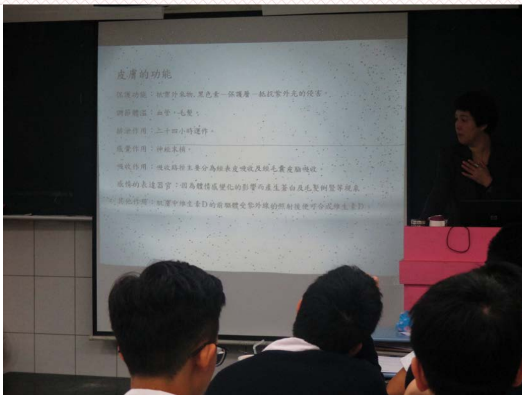
應用外語科日文組-三年禮班 104/03/25 活動情形：了解自己的皮膚屬性