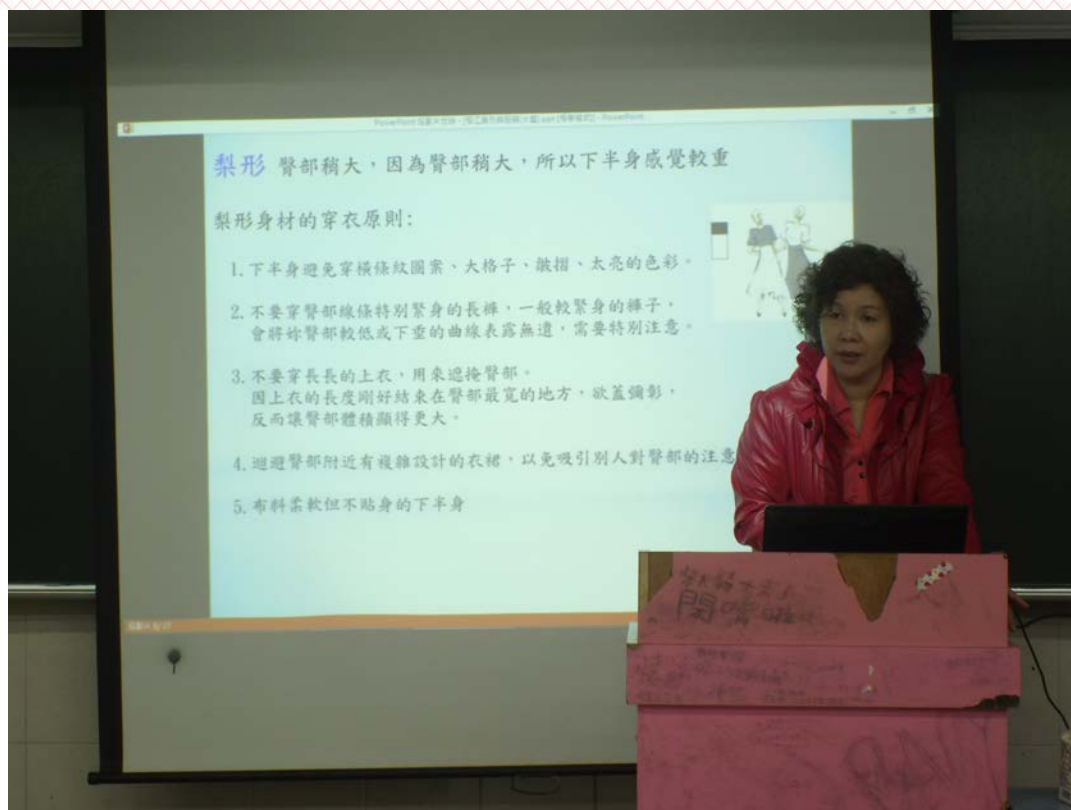
應用日文科-三年義班 105/04/07 活動說明：梨形身材穿衣原則