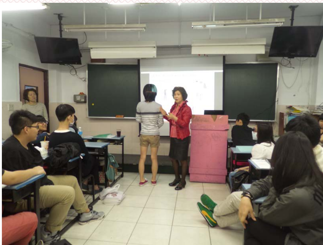
應用日文科-三年義班 105/04/07 活動說明：身材比例講解