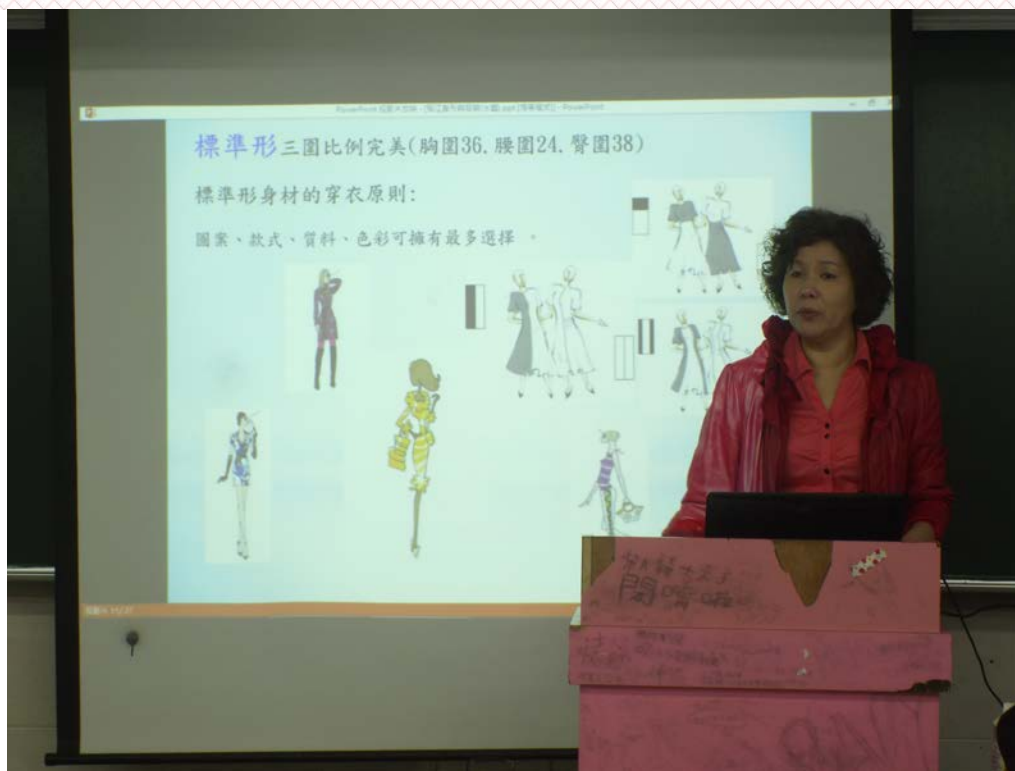
應用日文科-三年義班 105/04/07 活動說明：標準型身材穿衣原則