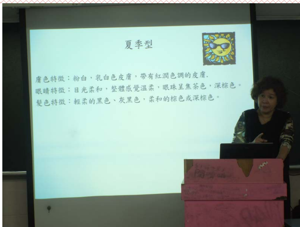
應用日文科-三年義班 105/04/14 活動說明:夏季型的特徵