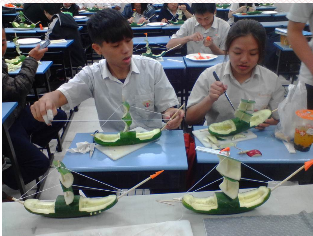
實用技能學程-二年美班 104/03/24