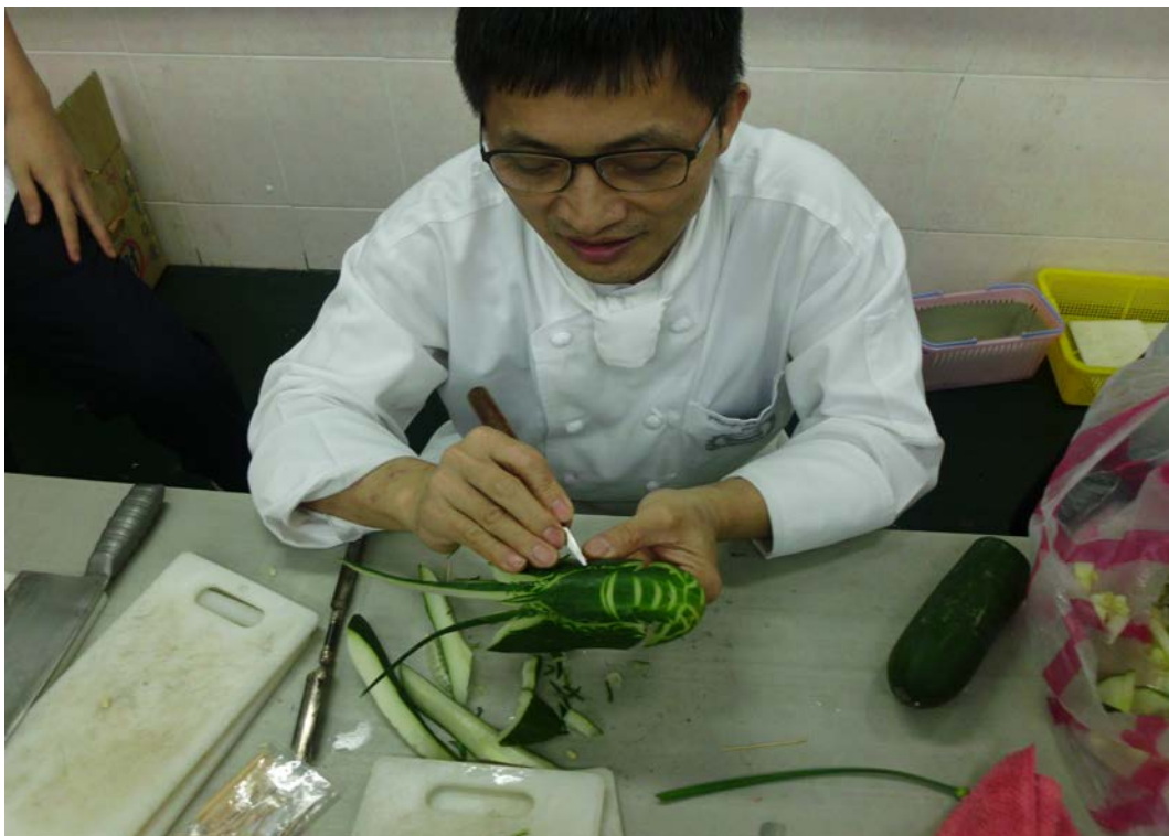
實用技能餐飲科-二年美班