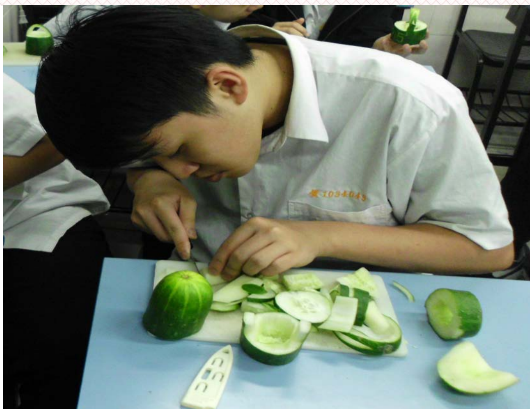
實用技能餐飲科-二年美班